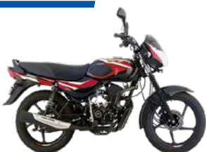
NEGRO - ROJO