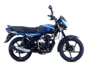
NEGRO - AZUL